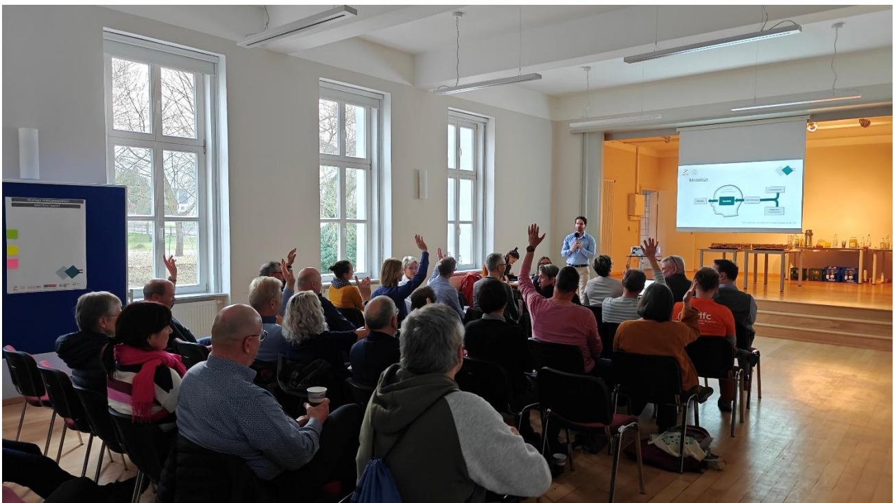
Abbildung 1: Einstimmung in die Veranstaltung über die Abfrage der Anreise.

Die Auftaktveranstaltung zum Mobilitätsplan Zittau und Ortsteile 2035 war sehr gut besucht und machte bereits zu Beginn sichtbar, wie vielfältig Mobilität in Zittau heute gelebt wird. In einer ersten Mobilitätsabfrage im Plenum zeigte sich, dass die Veranstaltungsteilnehmenden mit ganz unterschiedlichen Verkehrsmitteln zur Veranstaltung gekommen waren: zu Fuß, mit dem Rollator, mit dem Fahrrad, mit Bus und Bahn sowie mit dem Auto. Damit setzte die Veranstaltung unmittelbar ein zentrales Signal für den weiteren Planungsprozess: Der Mobilitätsplan soll die unterschiedlichen Alltagsrealitäten in Zittau und den Ortsteilen zusammenführen und sichtbar machen.