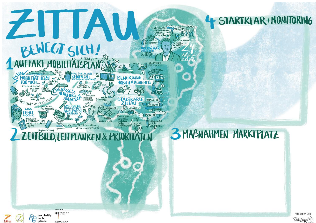
Abbildung 2: Visualisierung der Veranstaltungsergebnisse.