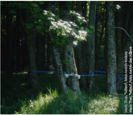
Koláčková, Tříšťová, Fotos: Anselmy, eutsche Mark Ther, Töpferberg, Foto: Anselmy, eutsche