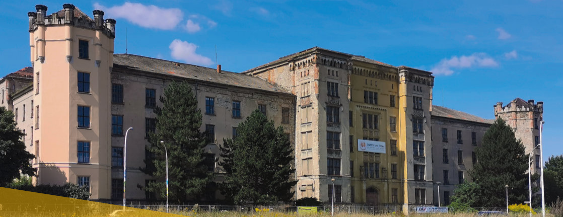
Mandaukaserne Mandavské kasárny